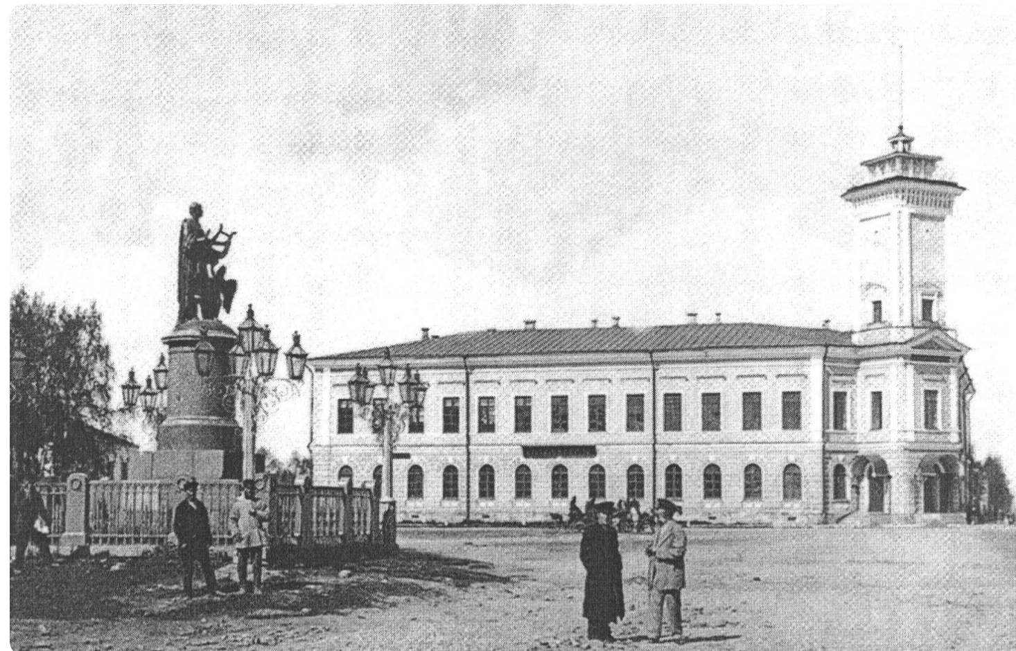
Здание Архангельского Губстаткомитета

Свою историю органы государственной статистики Архангельской области ведут с 1835 года. В этот год 17 апреля состоялось первое заседание губернского статистического комитета под председательством архангельского гражданского губернатора Ильи Ивановича Огарева.